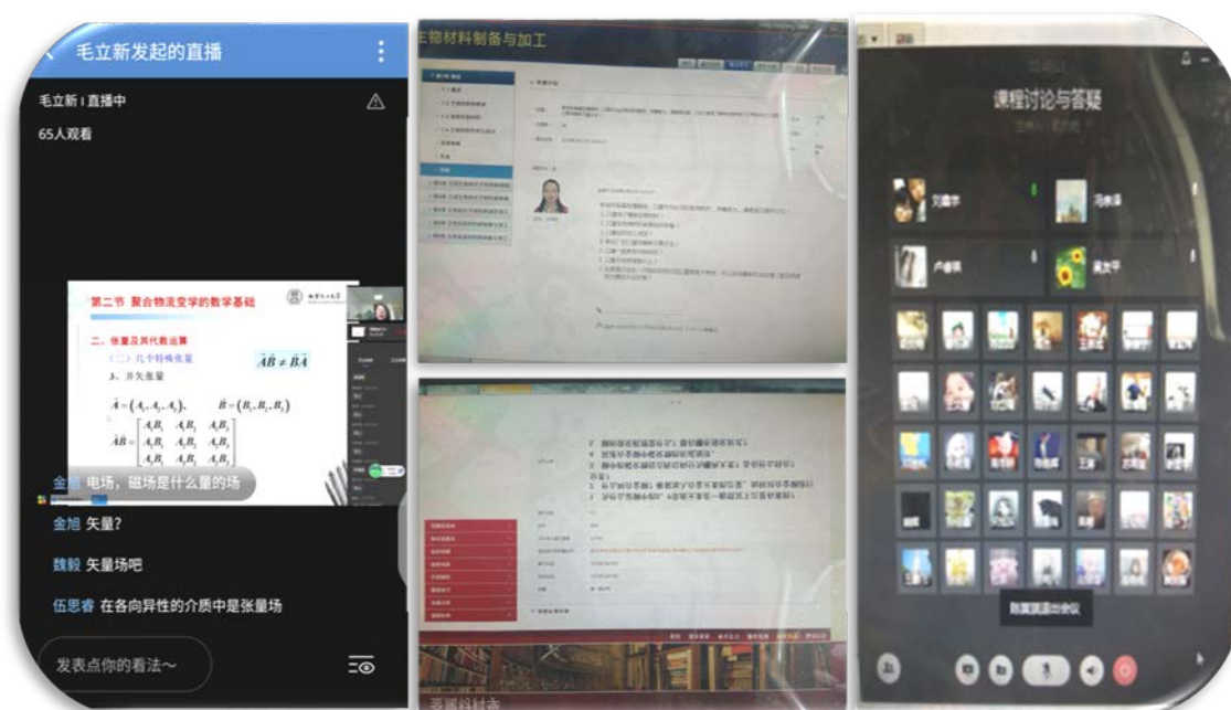
教师建立课程群并利用多种教学平台授课

为了保证线上教学质量，老师们学习并尝试了多种教学平台，如雨课堂、腾讯课堂、B站直播和企业微信等形式辅助教学。